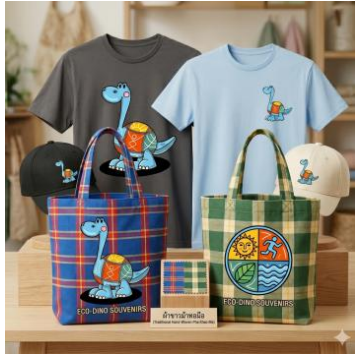
(ของที่ระลึก)